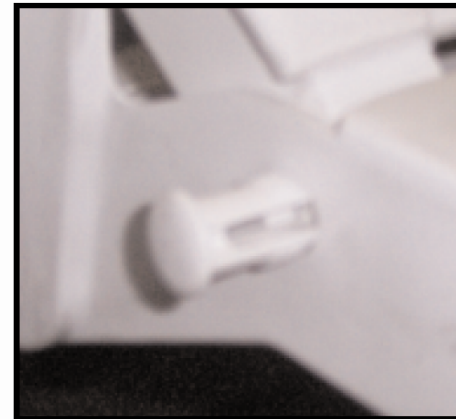
CLOSEUP OF PIN SHOWN ABOVE ACERCAMIENTO DEL PERNO EN EL AGUJERO