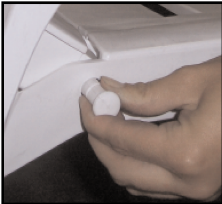
STEP 4: PLACE PIN IN HOLE PASO 4: COLOQUE EL PERNO EN EL AGUJERO