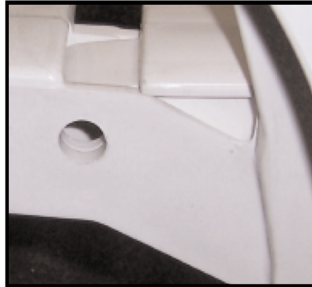
STEP 2: ALIGN PIN HOLES PASO 2: ALINIE LOS AGUJEROS DE LOS PERNOS