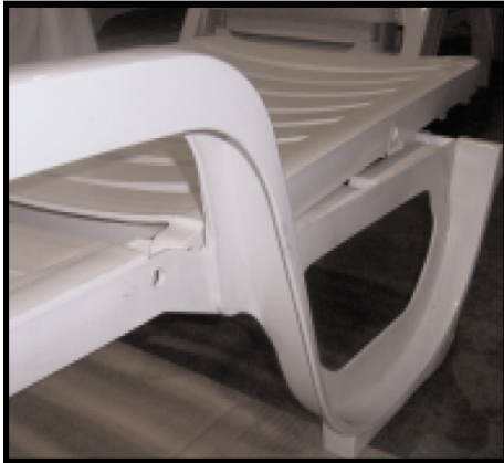
STEP 1: PUT BACKREST IN FRAME PASO 1: COLOQUE EL RESPALDO EN LA ESTRUCTURA

NOTA: ¡NO DESARMAR EL RESPALDO Y EL BRAZO AJUSTABLE!