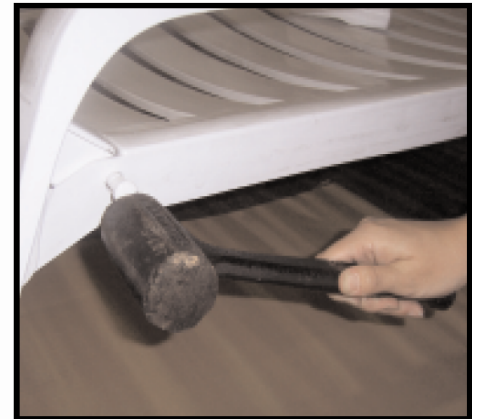
STEP 5: USING Mallet DRIVE PIN PASO 5: USANDO EL MAZO INTRODUCZA EL PERNO