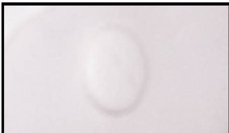
STEP 6: PIN FLUSH WITH SURFACE PASO 6: EL PERNO DEBE ESTAR AL MISMO NIVEL QUE LA SUPERFICIE